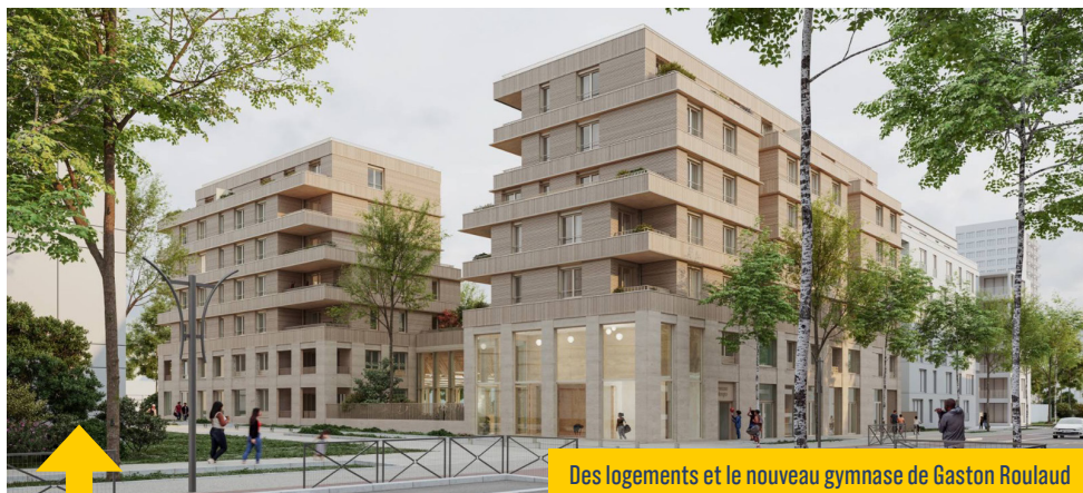
Des logements et le nouveau gymnase de Gaston Roulaud

Le nouveau quartier accueillera des logements diversifiés , en logement social, en locatif intermédiaire ou privé et en accession à la propriété. Cela à 400 mètres de la nouvelle gare de métro , en construction face à Avicenne.