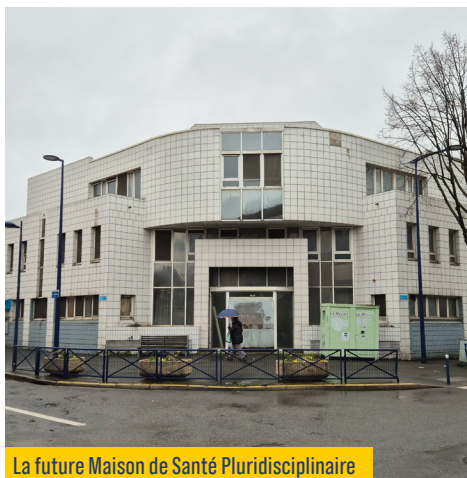
La future Maison de Santé Pluridisciplinaire