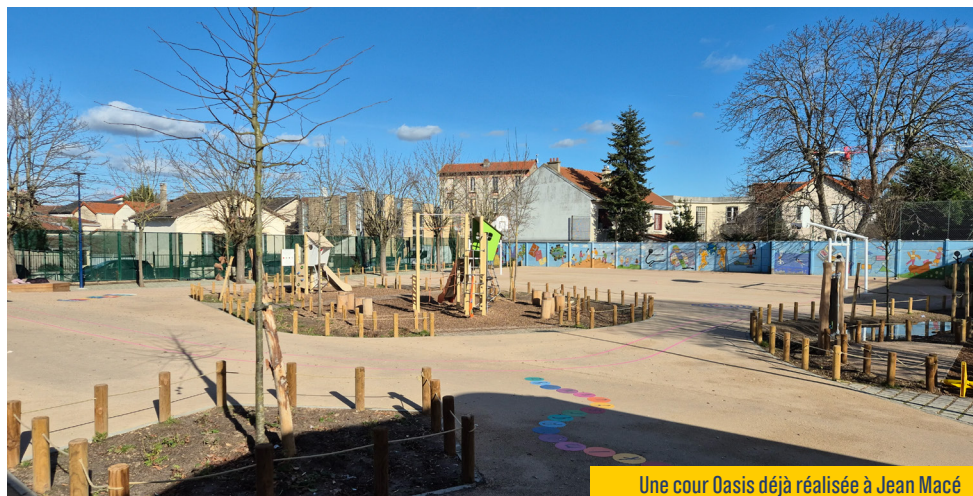
Une cour Oasis déjà réalisée à Jean Macé

Drancy est la ville du département qui consacre le plus de moyens pour les écoles et l'accompagnement scolaire ! Rien que pour les moyens en matériel scolaire, c'est 31€ par an et par enfant pour l'Éducation quand des villes comme Bobigny n'y consacrent que 9€, et la moyenne du département n'est que de 22€.