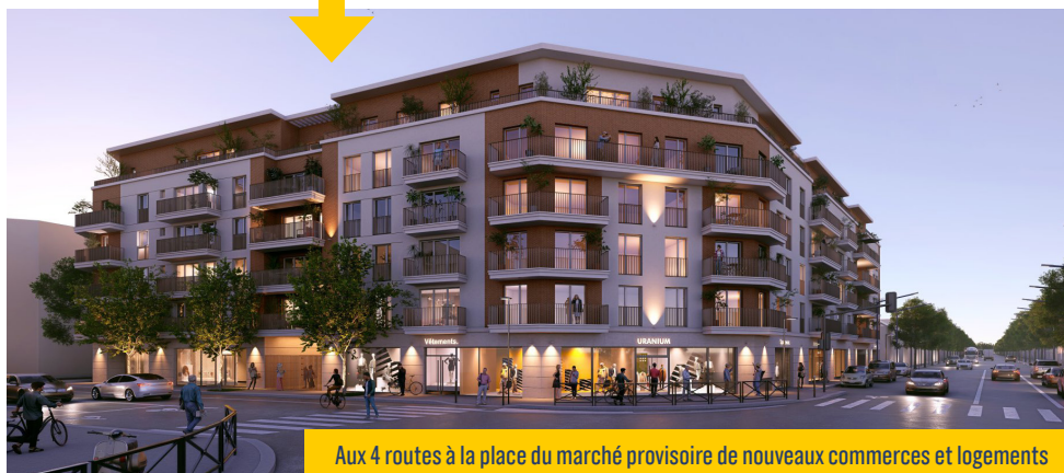
Aux 4 routes à la place du marché provisoire de nouveaux commerces et logements