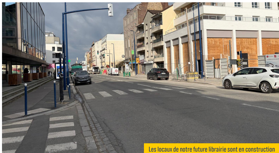
Les locaux de notre future librairie sont en construction