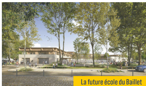
La future école du Baillet

• Nous allons construire une nouvelle école moderne et écologique de 24 classes dans le quartier du Baillet.